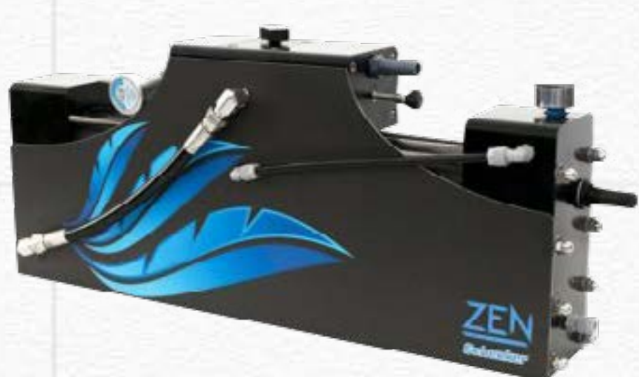
ZEN 30 - AC/DC