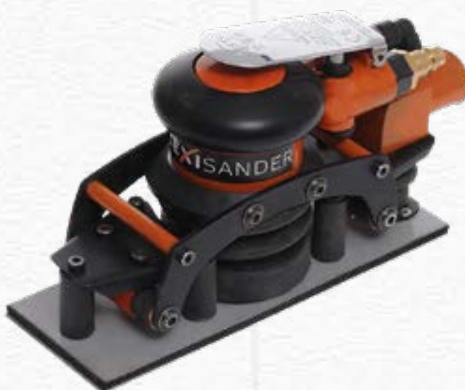
Pneumatic Flexible Orbital Sander