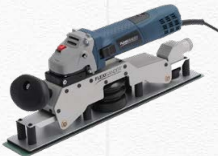
Electric Flexible Orbital Sander FS 40070E