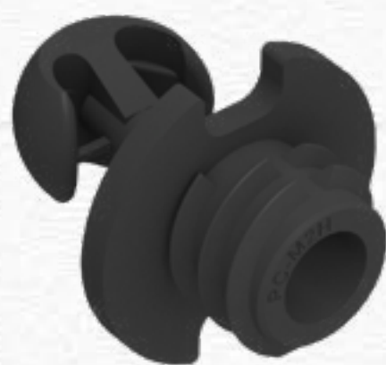
PC-M2H STANDARD CLIP