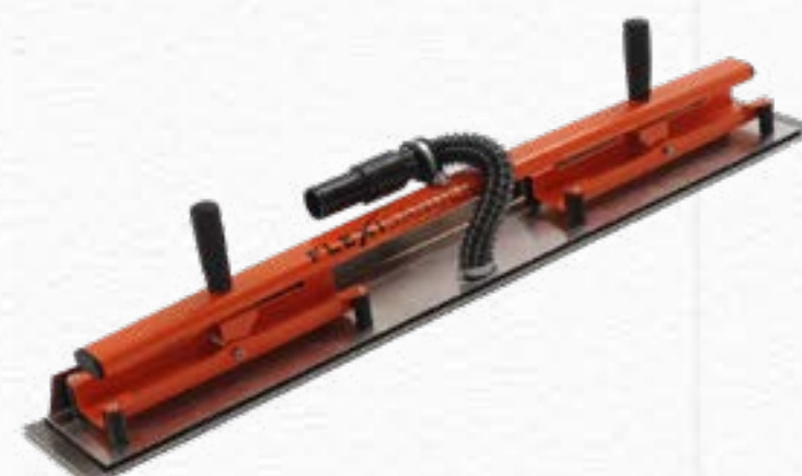
Flexible Sanding Board FSB084112DE | 840mm