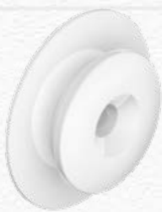
TC-M6 TEXTILE CLIP MALE