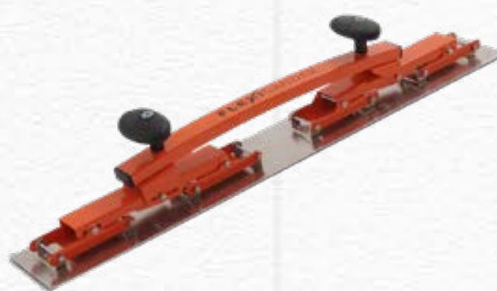
Flexible Sanding Board FSB084112 | 840mm