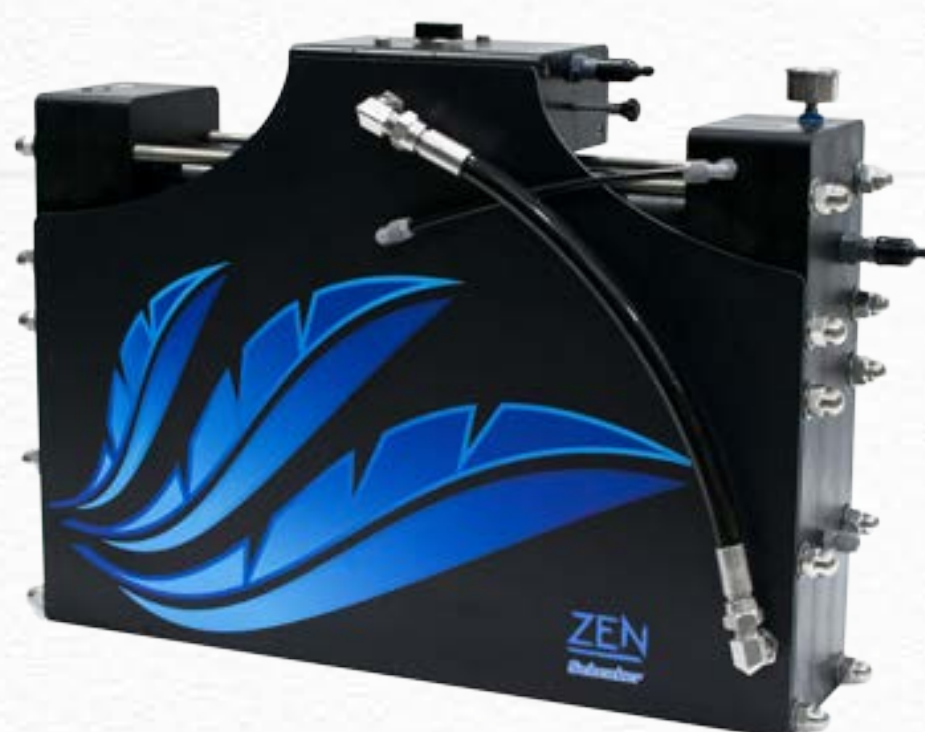
ZEN 150 - AC/DC