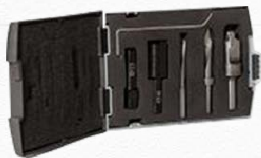
CT-08 YARD KIT 6 TOOLS