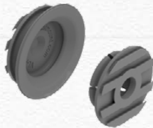
VL-03 VERY LOW PROFILE