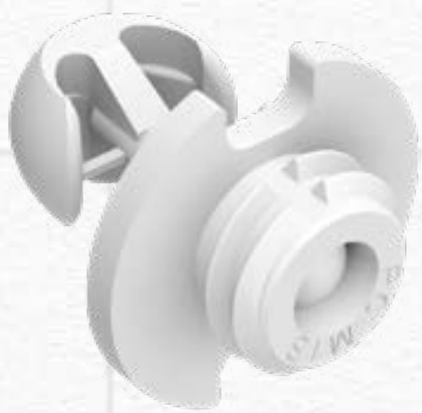
PC-M1B STANDARD CLIP