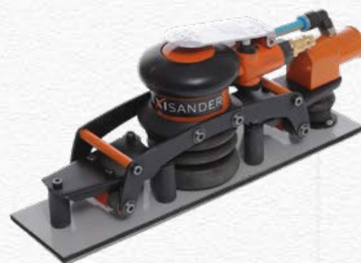
Pneumatic Flexible Orbital Sander FS 28070A | 280mm