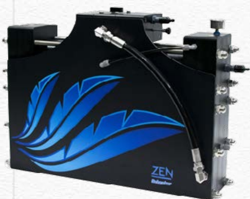
ZEN 100 - AC/DC