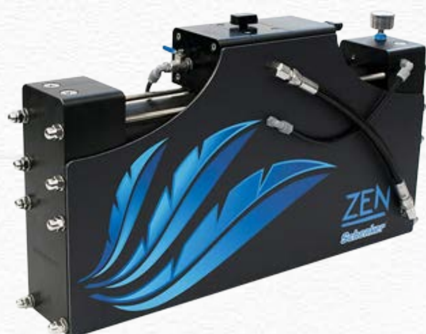
ZEN 50 - AC/DC