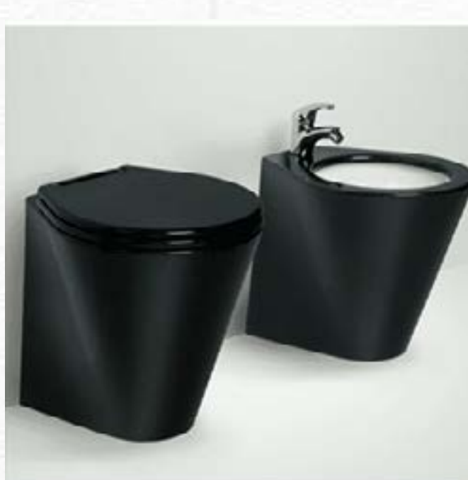
Race Carbon Fibre