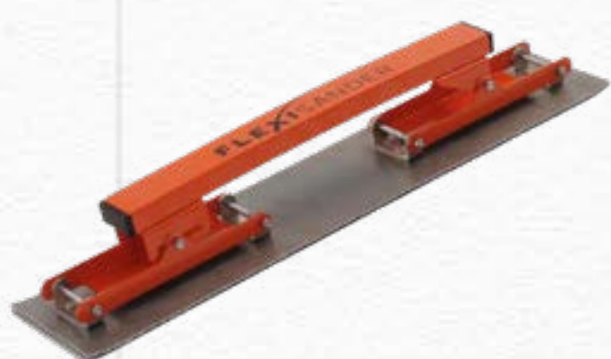
Flexible Filler Spatula FFK 056111