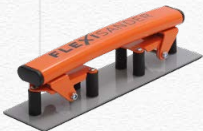
Flexible Sanding Board FSB028071 | 280mm