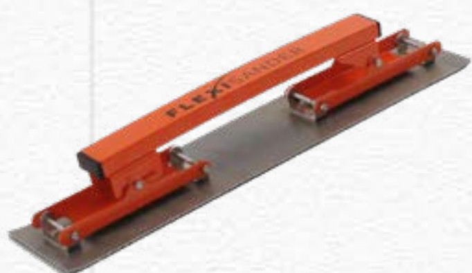
Flexible Sanding Board FSB 056111 | 560mm