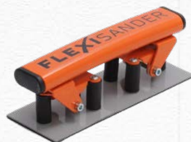
Flexible Sanding Board FSB019071 | 198mm