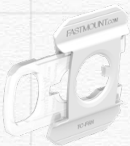
TC-F6H TEXTILE CLIP FEMALE